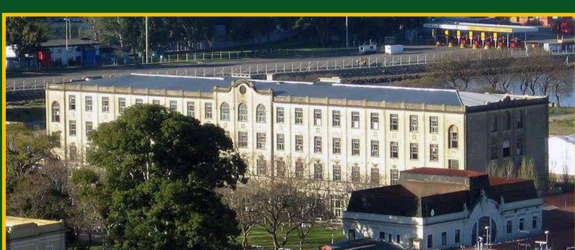
« Hôtel des immigrants à Buenos Aires »

Argentina es el octavo país del mundo por su superficie de 2 780 400 km 2 (cinco veces la superficie de Francia, cinco veces y media la superficie de España.) La capital Buenos Aires tiene una población que alcanza los 41,5 millones de habitantes. Argentina mide 3700 km del norte al sur y 1400 km del este al oeste. Se puede dividir el territorio en cuatro zonas distintas: las llanuras fértiles de la Pampa en el centro del país, el país llano de la Patagonia del sur que se extiende en más de un cuarto sur del país (28 %) hasta Tierra de fuego, las llanuras secas de Gran Chaco al norte y para terminar la región más alta de la Cordillera de los Andes al oeste a lo largo de la frontera con Chile cuyo monte Aconcagua culmina a 6960 metros (es la cumbre más alta en el mundo después de los montes de Asia).