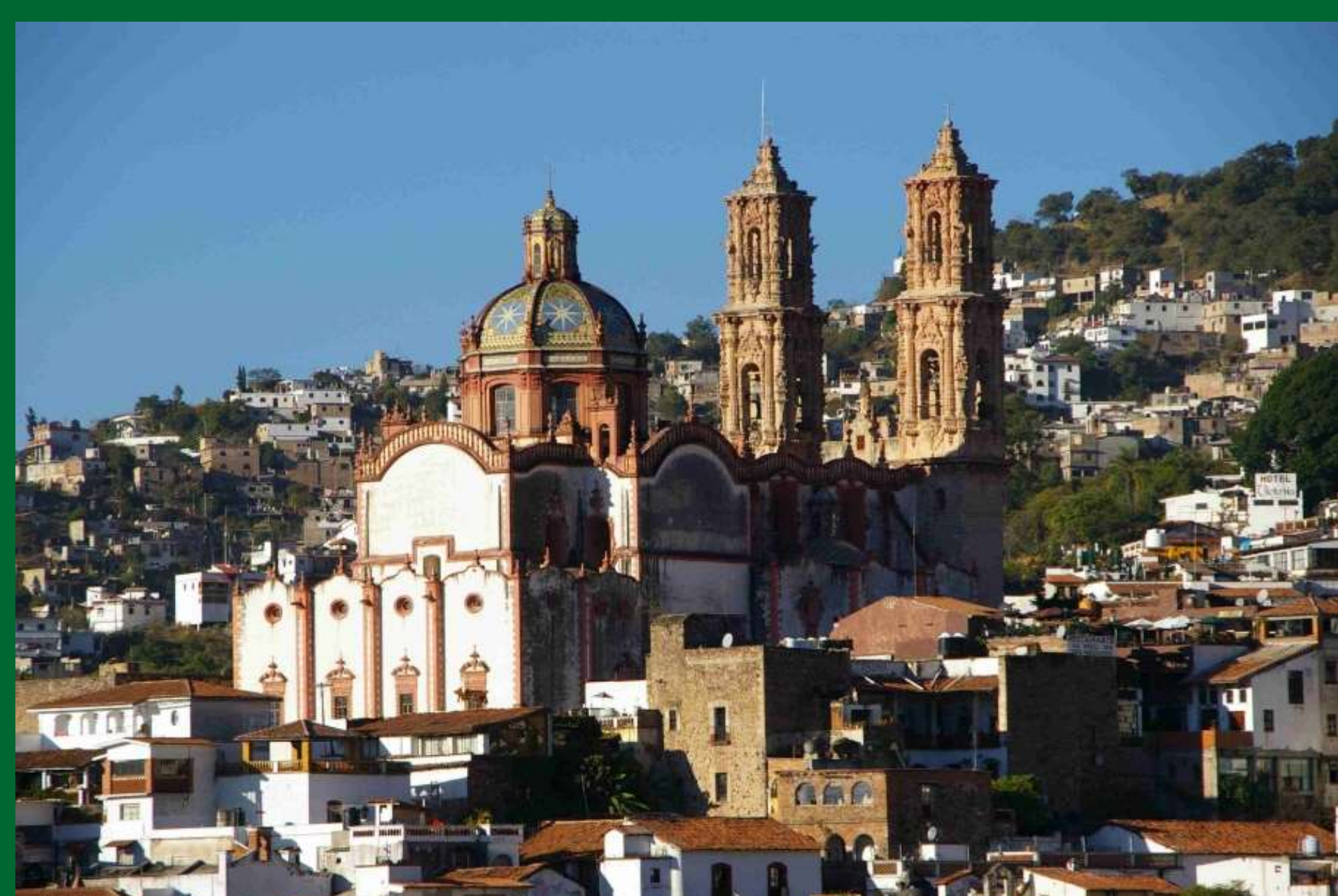
Eglise Santa Prisca y San Sébastian

Joseph Laborde : Né à Oloron vers 1699 devenu José de la Borda bienfaiteur de Taxco et de sa région. Parti très pauvre, travaillant comme mineur de fond, il a amassé une fortune considérable dans les mines de métaux précieux. Il a lancé la mécanisation de l'extraction minière, créé un réseau d'eau potable dans la ville, et fait construire de ses deniers un des joyaux de la ville de Taxco, l'église Santa Prisca y San Sebastian.