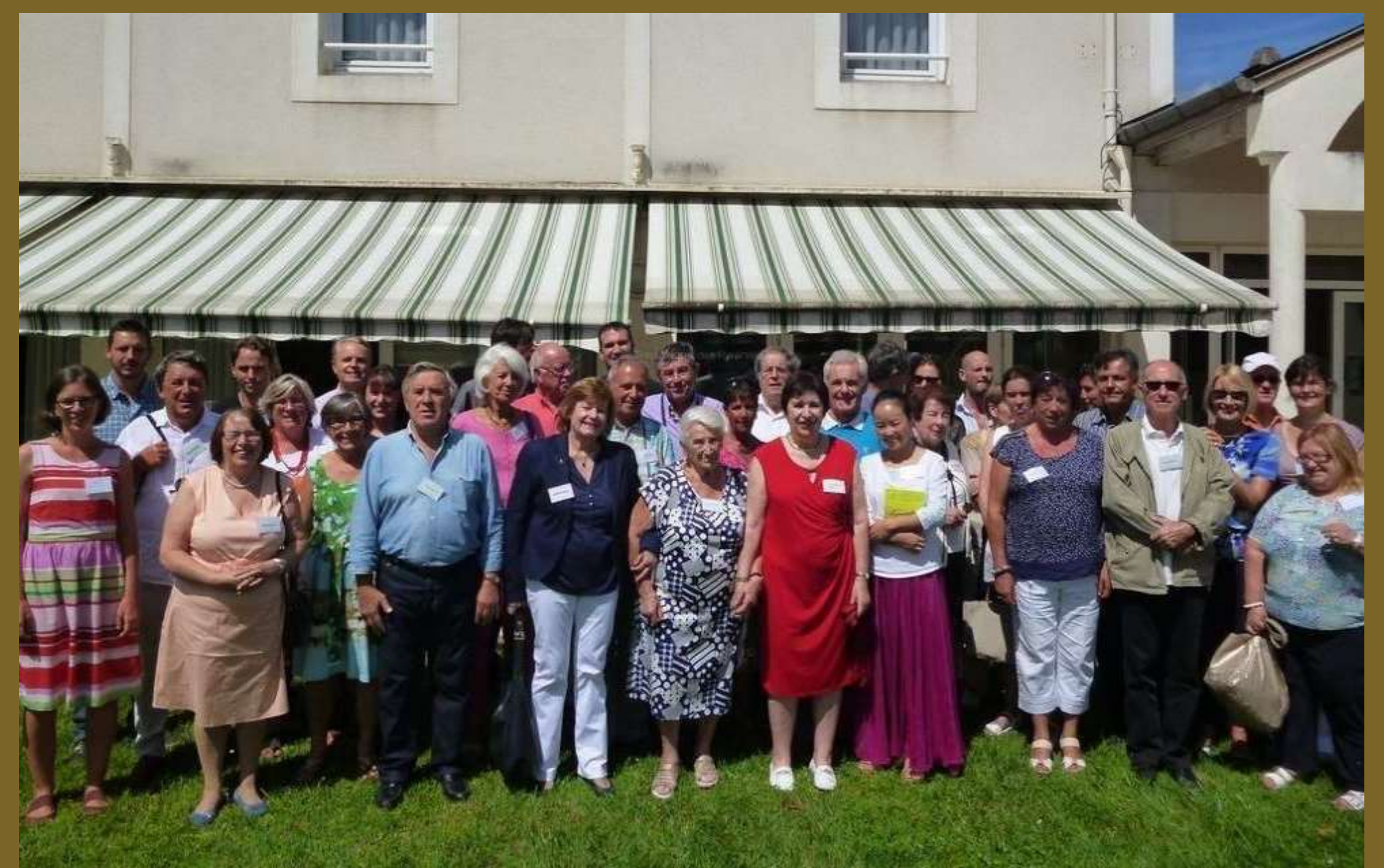
Les descendants de la famille Supervielle rassemblés à Oloron en 2014