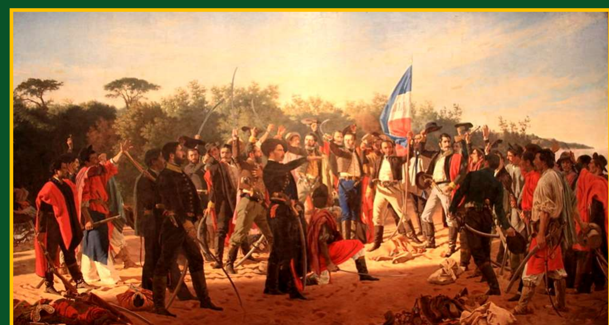
Serment des Trenta y Tres Orientales

Poblado con tribus indias, Charrúas y Guaraníes, Uruguay fue colonizado por España y luego por Portugal de los que se independizó : Juramento de los Treinta y Tres Orientales. Sus recursos principales son la ganadería y la agricultura